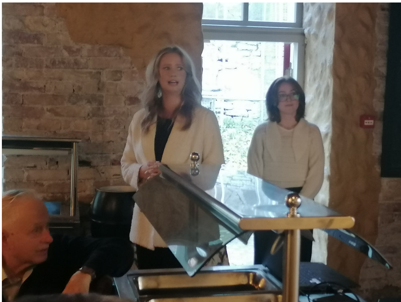
Lõpetasime kooslemise ühise palveosadusega!